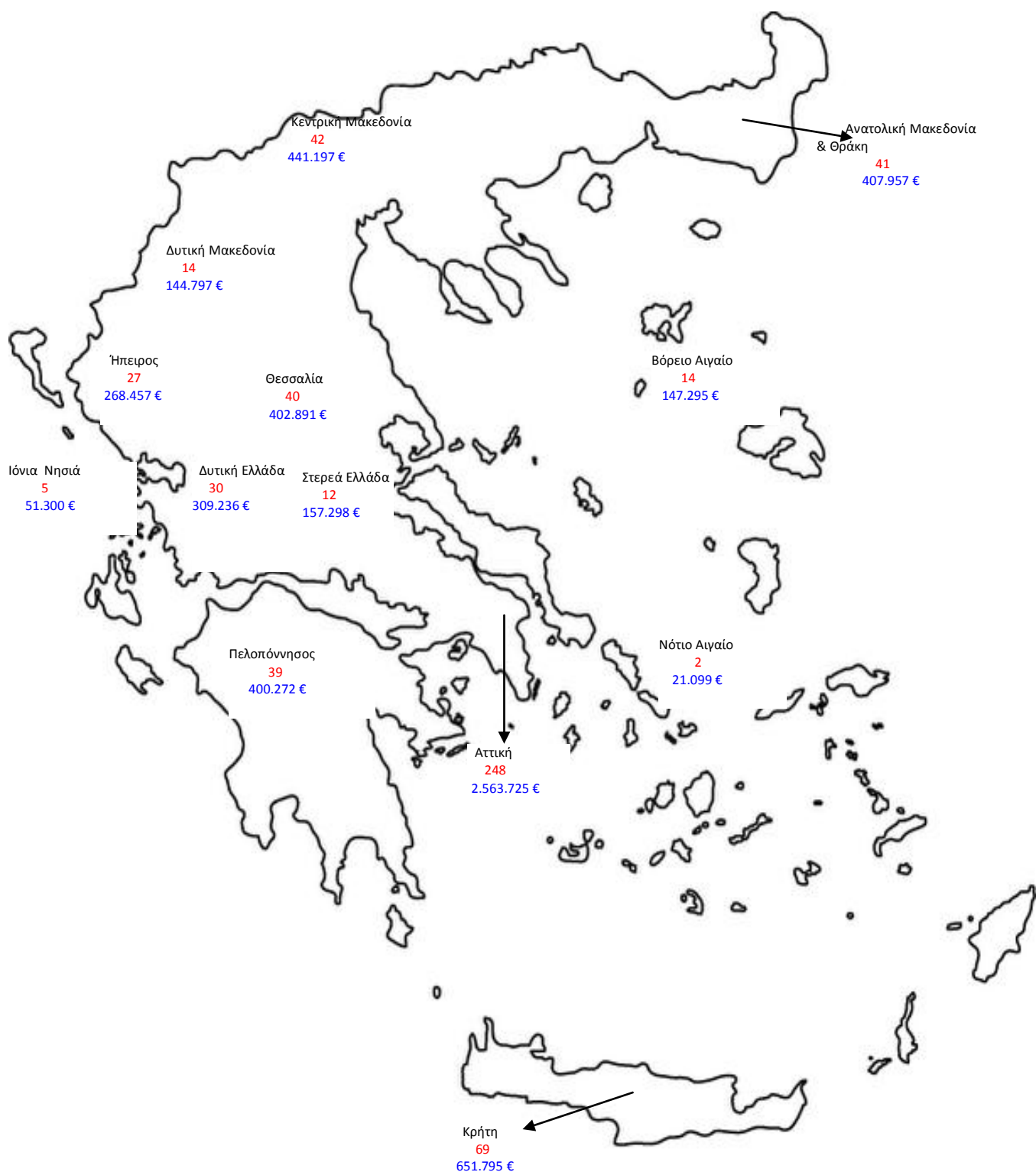
ΧΑΡΤΗΣ : ΑΔΗΛΩΤΟΙ ΕΡΓΑΖΟΜΕΝΟΙ ΚΑΙ ΠΟΣΑ ΕΠΙΒΛΗΘΕΝΤΩΝ ΠΡΟΣΤΙΜΩΝ ΑΝΑ ΠΕΡΙΦΕΡΕΙΑ